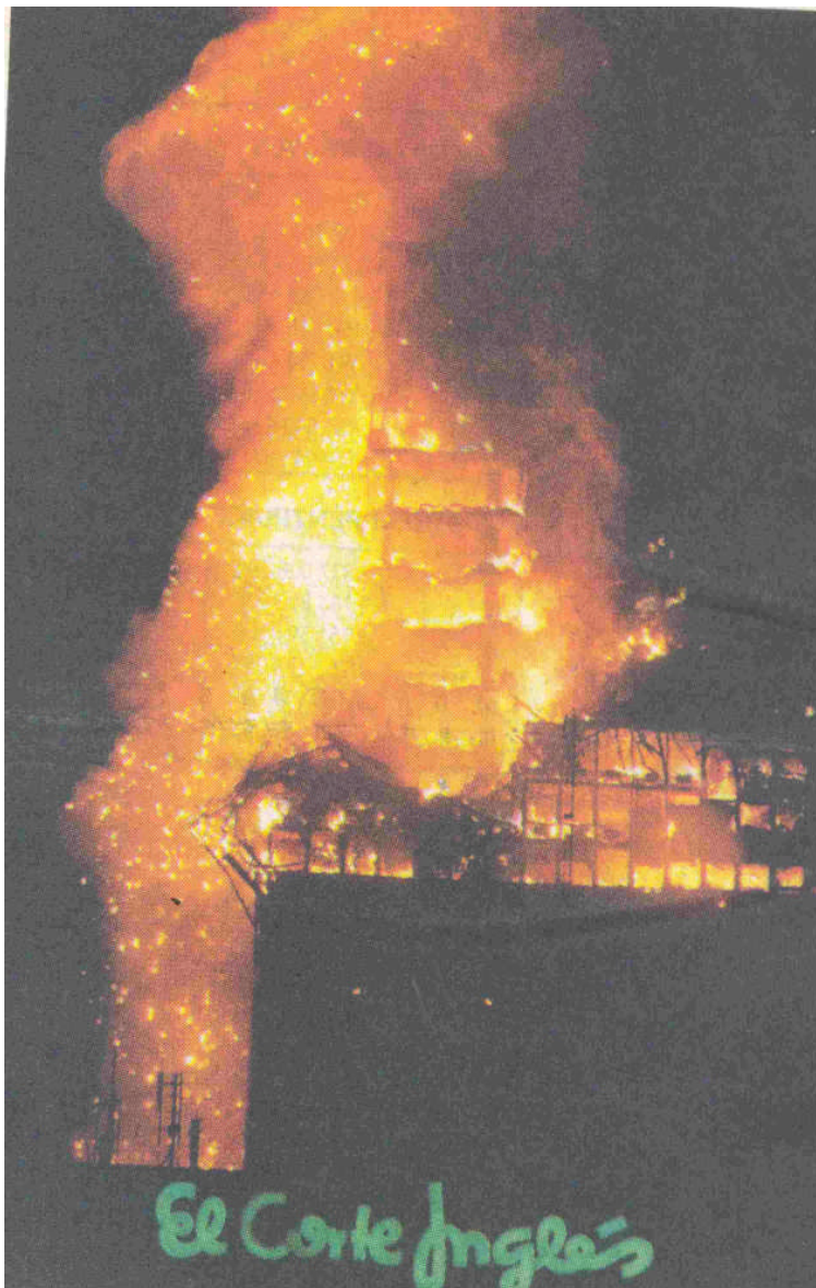
14. kép. Fáklyaként égő toronyház Madridban

A teljességre való törekvés nélkül - rendszerezés és csoportosítás nélkül – álljon itt a biztonságot pozitív, vagy negatív irányban befolyásoló fogalmak, kifejezések egy halmaza.