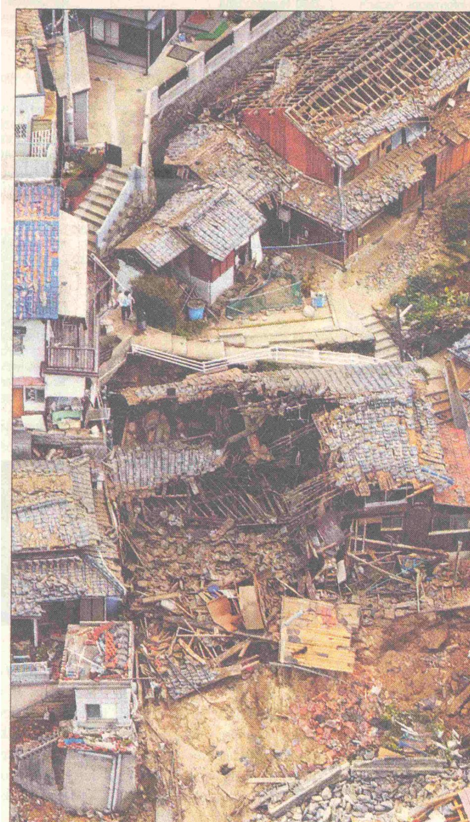
6. kép. Földrengés Japánban

létrehozni, melynek feladatrendszerét törvényben szabályozni kell, a beavatkozó szervezetet felkészülten készenléti állapotban kell tartani ahhoz, hogy katasztrófa esetén a gyakorlati teendőit időben elkezdhesse, és akadálytalanul és lehetőleg sikeresen végrehajtsa.