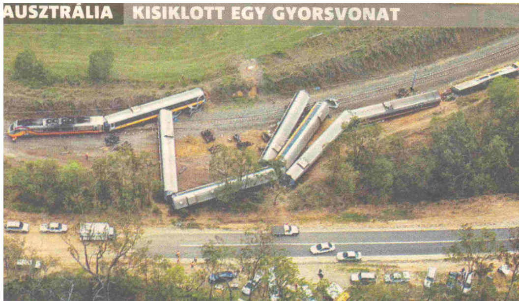
12. kép. Kisiklott gyorsvonat Ausztráliában

A biztonság korszerű értelmezése, azaz a biztonság ma már sokkal bizonytalanabb, mint korábban bármikor