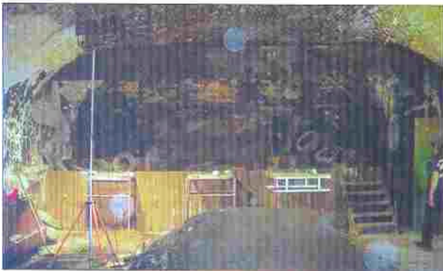
11. kép. Budapest. Múzeumtemi lőtér a tűz után