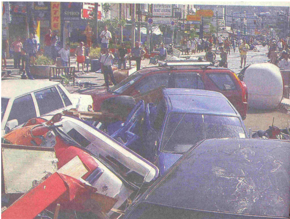
8. kép. Tájkép cunami után

Fogalmi meghatározás szerint a katasztrófavédelem, mint megelőző tevékenység a biztonsága szavatolásának az a részterülete, amely a maga reális képességeivel, szükség esetén nemzetközi, vagy világszervezetekkel együttműködve olyan állapotot képes biztosítani, amelyben kizárható, vagy megbízhatóan kezelhető az esetlegesen