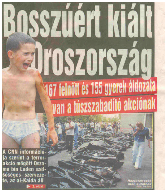
2. kép. A Beszlan-i terrorakció után