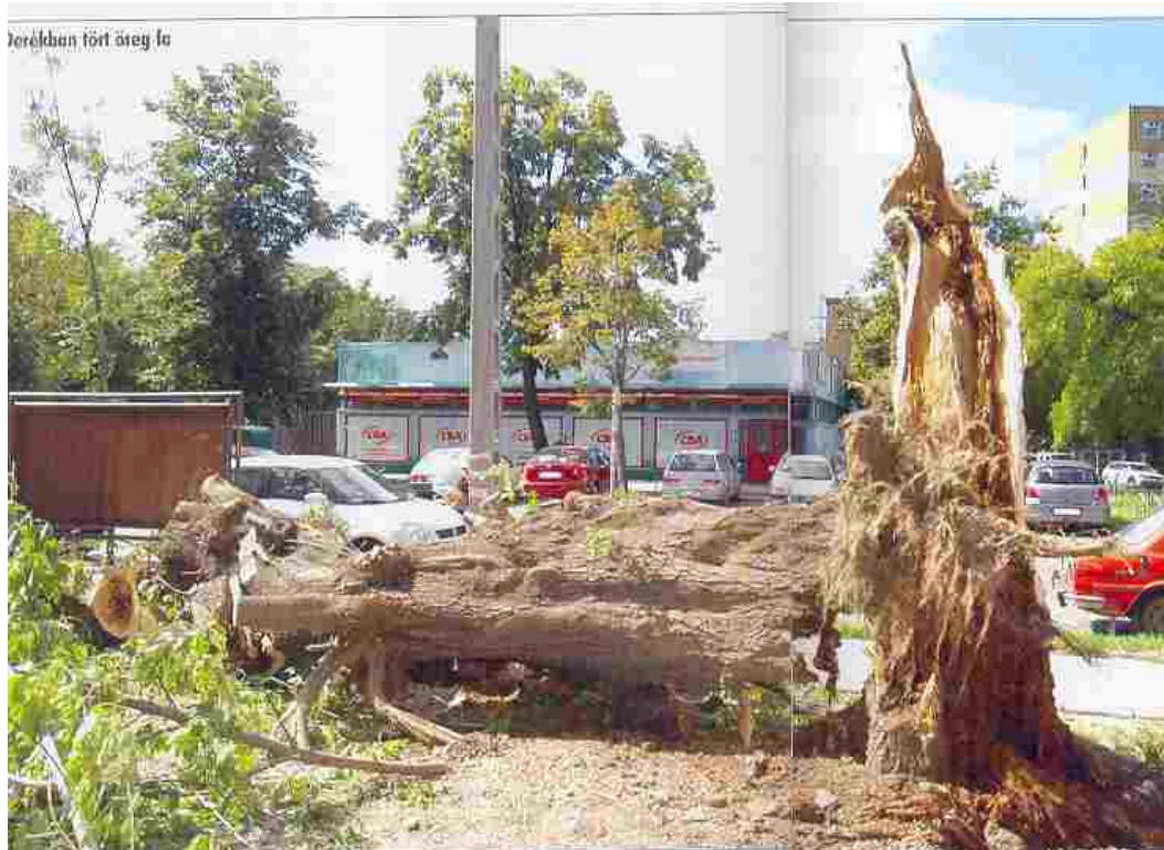
13. kép. Derékba tört öreg tölgyfa a 2006. augusztus 20-i szélvihar után Budapesten