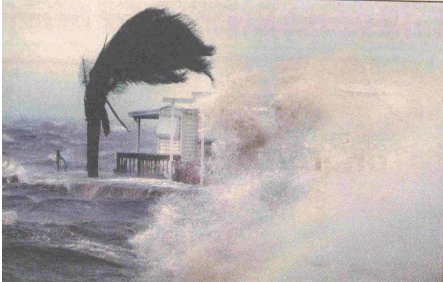
7. kép. A Frances hurrikán munkában

A biztonsággal kapcsolatos teendők elméleti megalapozásában első a katasztrófavédelem fogalmi meghatározása , ezt követi az ehhez illeszkedő katasztrófavédelmi rendszer létrehozása.