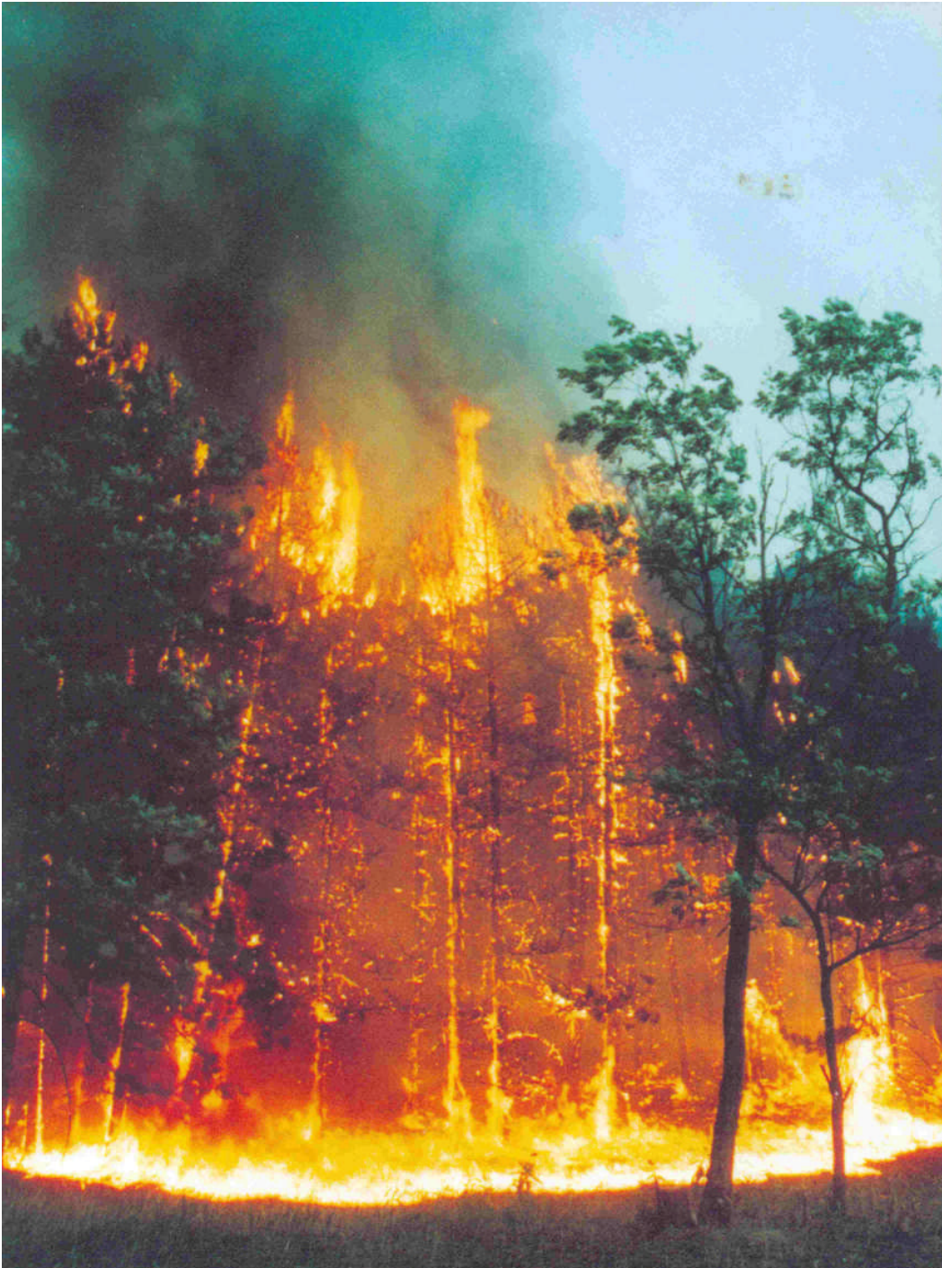
5. kép. Erdőtűz valahol Európában

megoldhatja, ezeknek a rendszereknek a katasztrófája elméletileg elkerülhető. De a mesterséges rendszerek is veszélyhordozók, katasztrófájuk is bekövetkezhet, számtalanszor be is következett.