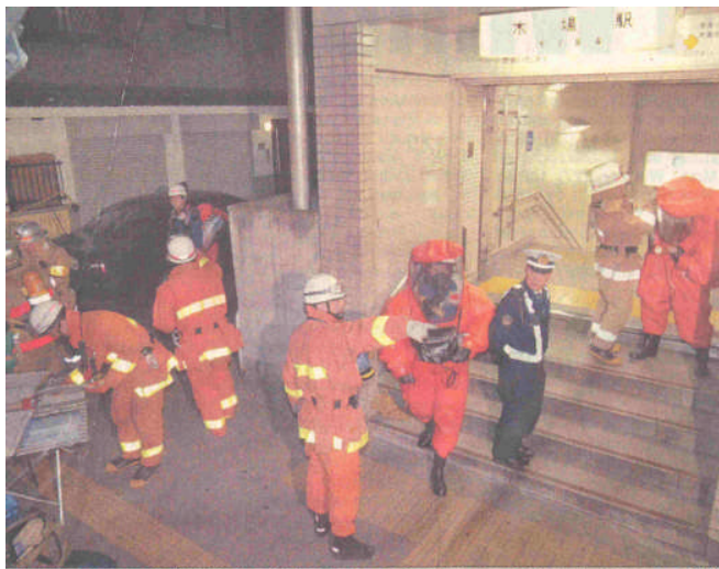
3. kép. Vegyi támadás a Tokió-i metróban

Ennek oka az, hogy egy-egy ország, ország csoport, nagyhatalom politikája nyomán az érdekek sérülése nemcsak egy országban jelentkezik, és az azt követő „reakció” a nemzeti kereteket meghaladja. A nemzetközi terrorizmus azonban annál több mint, amikor egyidőben több országban fordulnak elő terrorcselekmények. A legfőbb ismérv az, hogy az akciók többé-kevésbé előre megtervezettek, összehangoltak, szervezeten több ország illegális (vagy esetleg legális) szervezeteinek részvételével hajtják végre, és a legtöbb esetben több országot is érintenek, érinthetnek. Jellemző lehet, hogy egy nemzetközi szervezet elleni merénylet a cél, miközben a rombolásra felhasznált eszközök – amelyek nem éppen véletlenül például utasszállító repülőgépek, vagy esetleg más közlekedési eszközök - rövid idő alatt célba érnek, és az akció eredményeként szinte kivétel nélkül minden esetben több nemzet (állam) a szenvedő fél (pl. a World Trade Center elleni akció), tömeges emberáldozatot követelve.