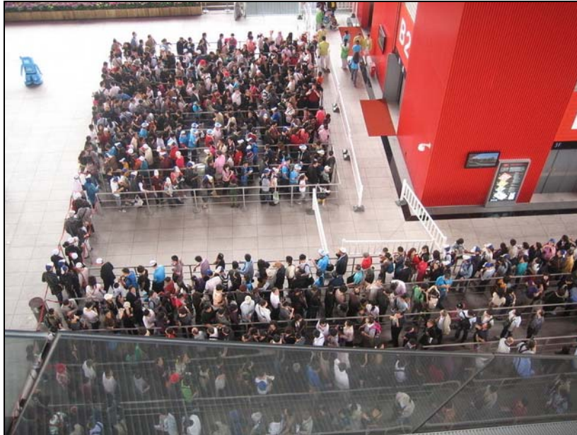
3. számú kép: A tömeg mozgásának kordonokkal történő szabályozása [10]