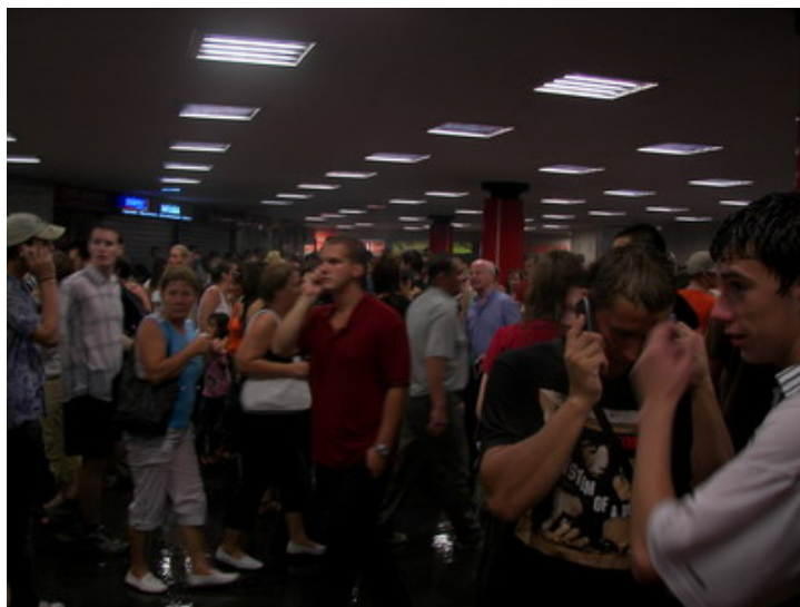
2. számú kép: Tömeg a metró aluljáró előterében [8]