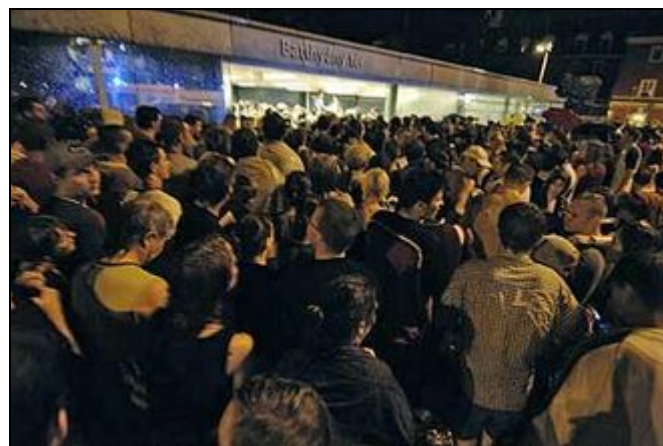
1. számú kép: A Batthyányi téri metrómegállóba menekülnek az emberek (2006. 08. 20.)[6]