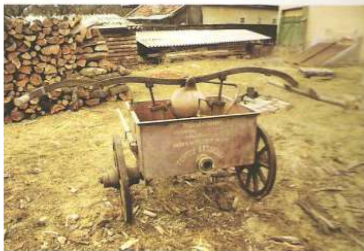
4. kép. Háromszéki pusztulásra ítélt tűzoltószerrek – Sepsibükszád, Torja, Ozsdola