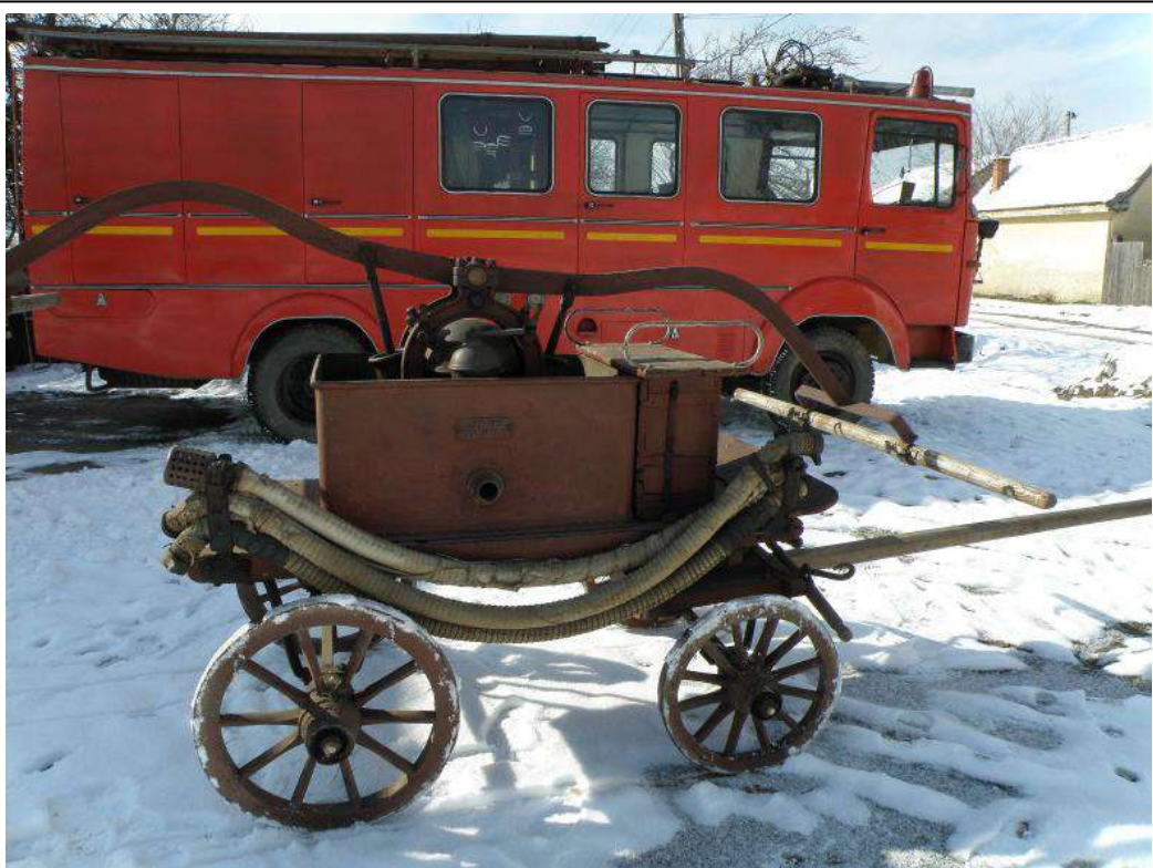
6. kép. Bereck négykerekű szekérfecskendője (gyártva 1891)