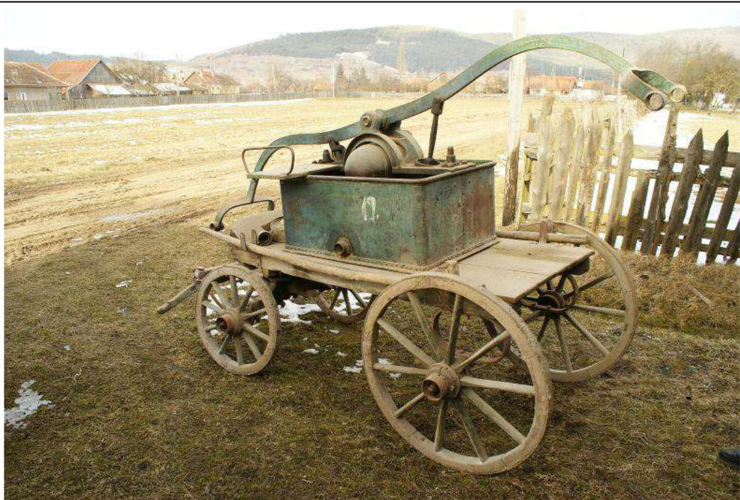
5. kép. Bélafalva négykerekű szekérfecskendője (beszerzés 1890)