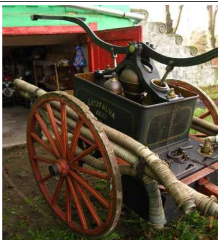
8. kép. Lécfalva Walser-féle targoncafecskendő (1899).