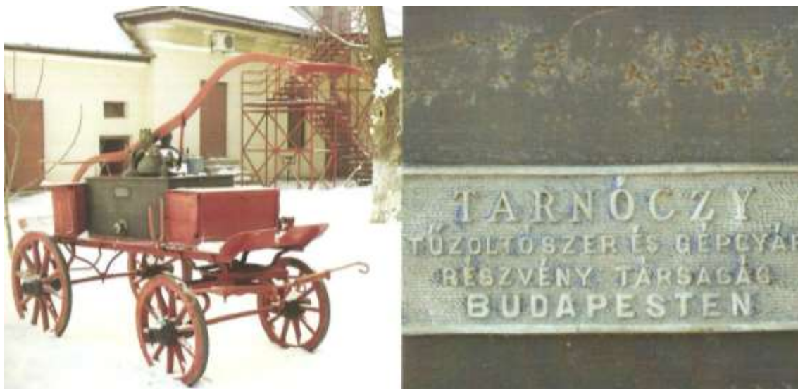
10. kép. Kökös Tarnóczy-féle négykerekű szekérfecskendő (gyártva 1892)