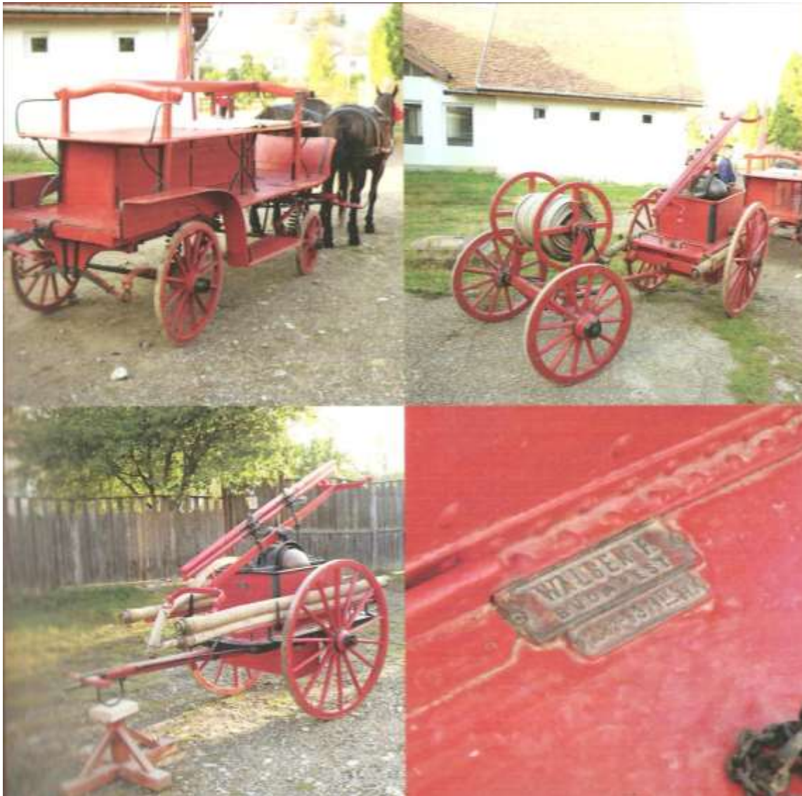
11. kép. Sepsikőröspatak tűzoltószer-vonat. Balra fent lófogatú személyszállító-szekér, balra lent kétkerekű targoncafecskendő, jobbra fent az összekapcsolt vonat kissé takarva a személyszállító, mögötte a targoncafecskendő és tömlőszekér, jobbra lent a gyári felírat (gyártva 1887)