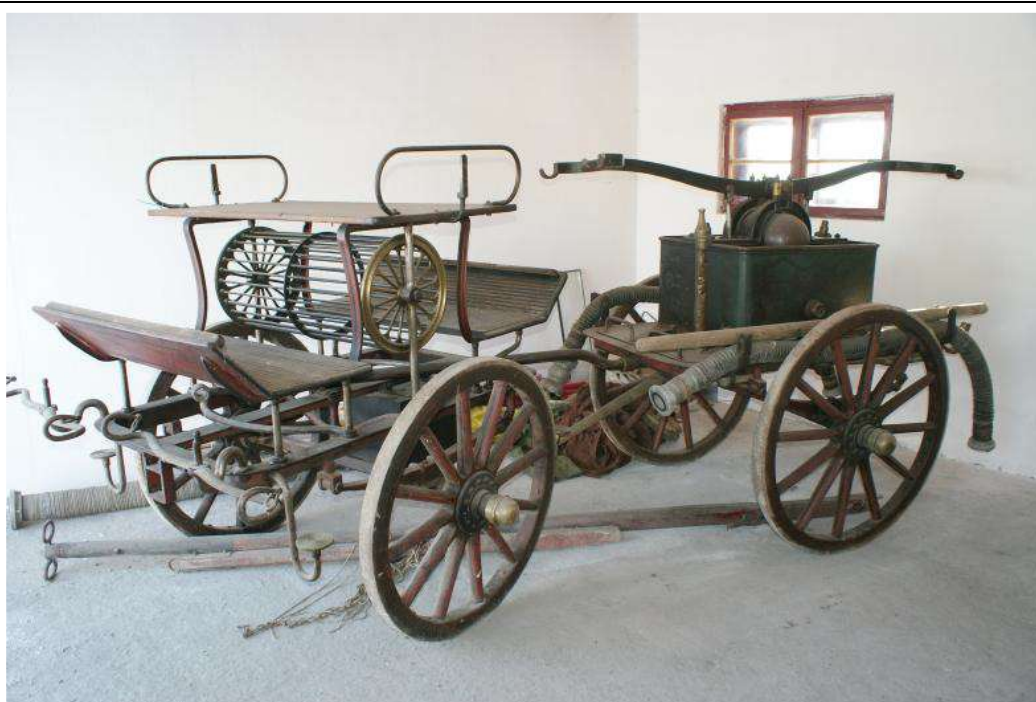
7. kép. Illyefalva kocsifecskendője (gyártva 1899)