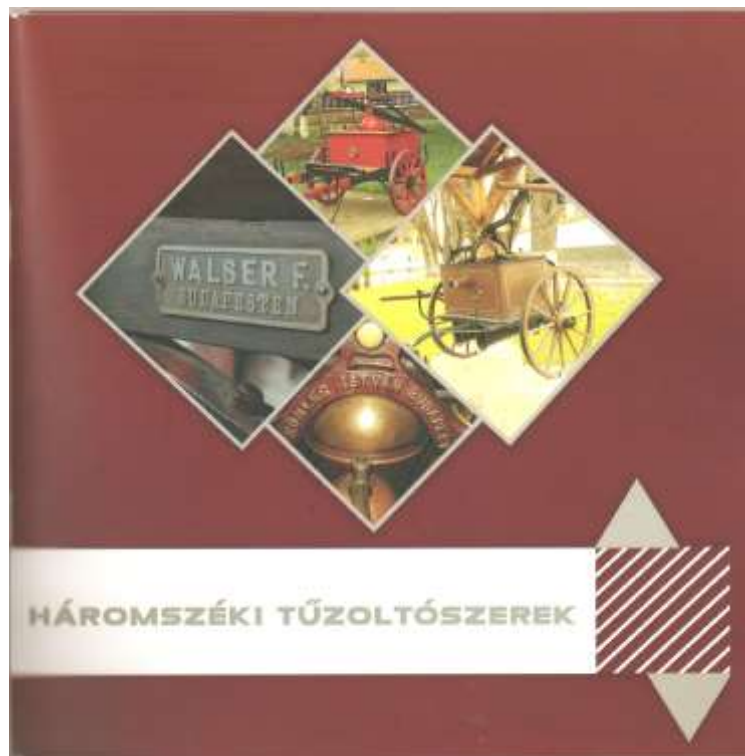
1. kép. A könyv fedőlapja

anyaga – még a Debrecenből a korábbi Országos Tűzoltó Múzeumba került anyag is – legfeljebb egy-egy csokorra való erekljét őriz az egykori Magyarországnak erről a tájékról. Ha a leendő múzeum az elmúlt századok emlékeinek teljes „arzenálját” bemutatja, akkor az anyaországban élők (köztük tűzvédelmi szakemberek) erdélyi turisztikai (magán, vagy hivatalos) útjának egyik érdekes állomása lesz.