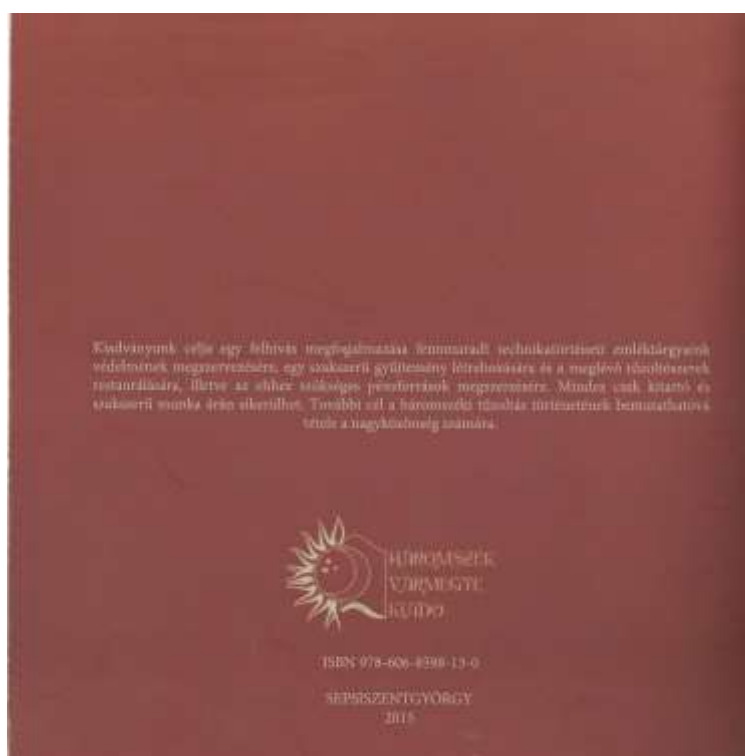
2. kép. A könyv hátsó borítója