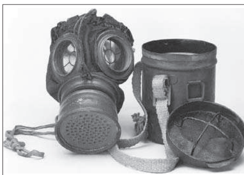
5. ábra. Osztrák–magyar 1917M gázálarc és doboza