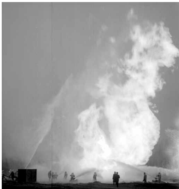
A zsanai gázkitörés

A tűzoltótiszt-képző iskola eredményes munkáját példázza, hogy az általa kiképzett tisztek zöme az életben, közéleti és szolgálati feladatok teljesítésében helytállt és helytáll, közülük számosan töltenek be magas vezetői beosztást az állami tűzoltóság szervezetében. A tanintézet tanári állománya a vele szemben támasztott társadalmi és szakmai igényeknek, a gazdasági és tűzvédelmi egyre növekvő követelményeknek mindenkor felelősséggel igyekezett eleget tenni.