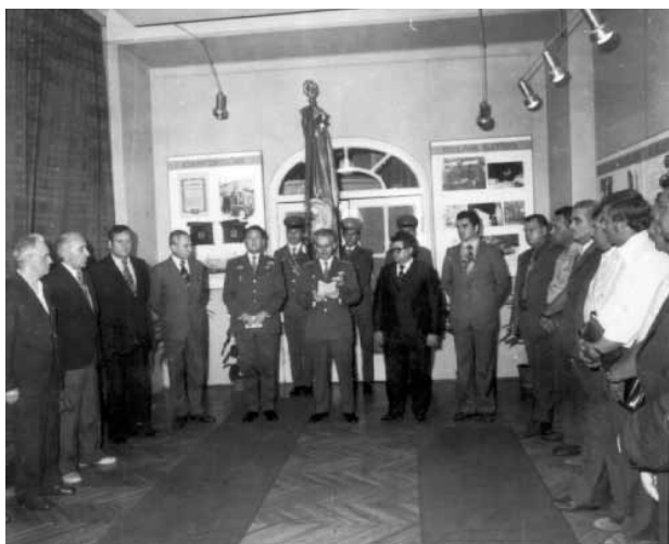
Az állami tűzoltótiszt-képzés 30. évfordulójára készített jubileumi kiállítás megnyitása

A tisztképzést – 2 éves nappali, illetőleg 3 éves levelező tagozaton, valamint a tiszthelyettesi (zászlósi) kiképzést (10 hónap) a BM Tűzoltó Tisztképző Iskola feladatkörébe utalta. Előírásokat tartalmazott a beiskolázás követelményeire, pl: tisztképző nappali tagozatán: legalább 1 éves tűzoltói szolgálat, alapfokú képesítés, érettség, vagy azzal egyenértékű szakiskolai végzettség, 35 év alatti életkor, orvosi javaslat az alkalmasságra és eredményes felvételi vizsga.