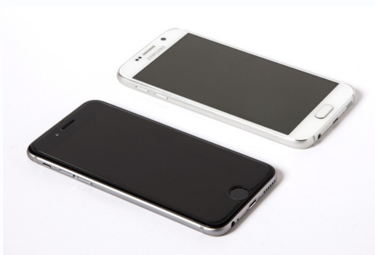
Traditional eLearning systems