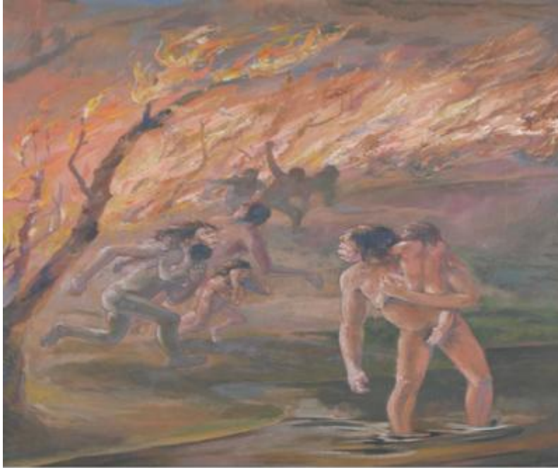
1. Régvolt elődeink és a tűz.