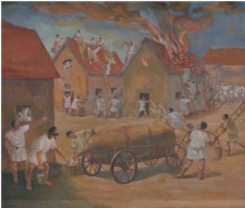
2. Küzdelem a tűzzel a középkorban.