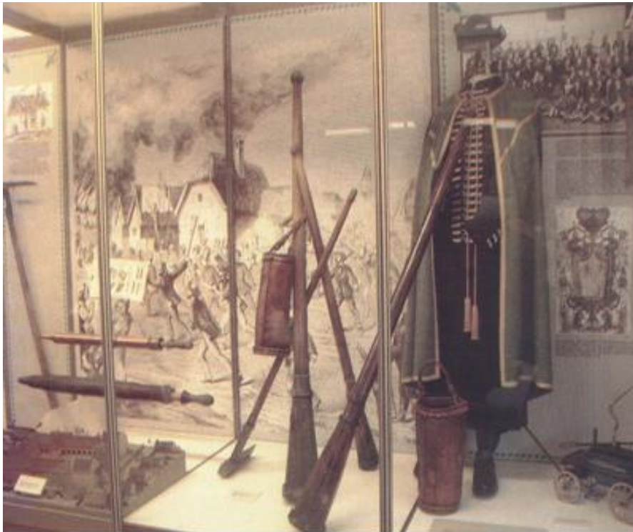
6. A debreceni diáktüzoltókat bemutató vitrinsor