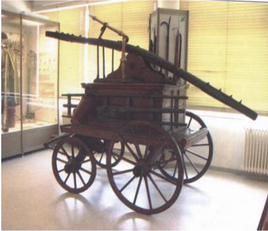
5. Gólyanyakú fecskendő