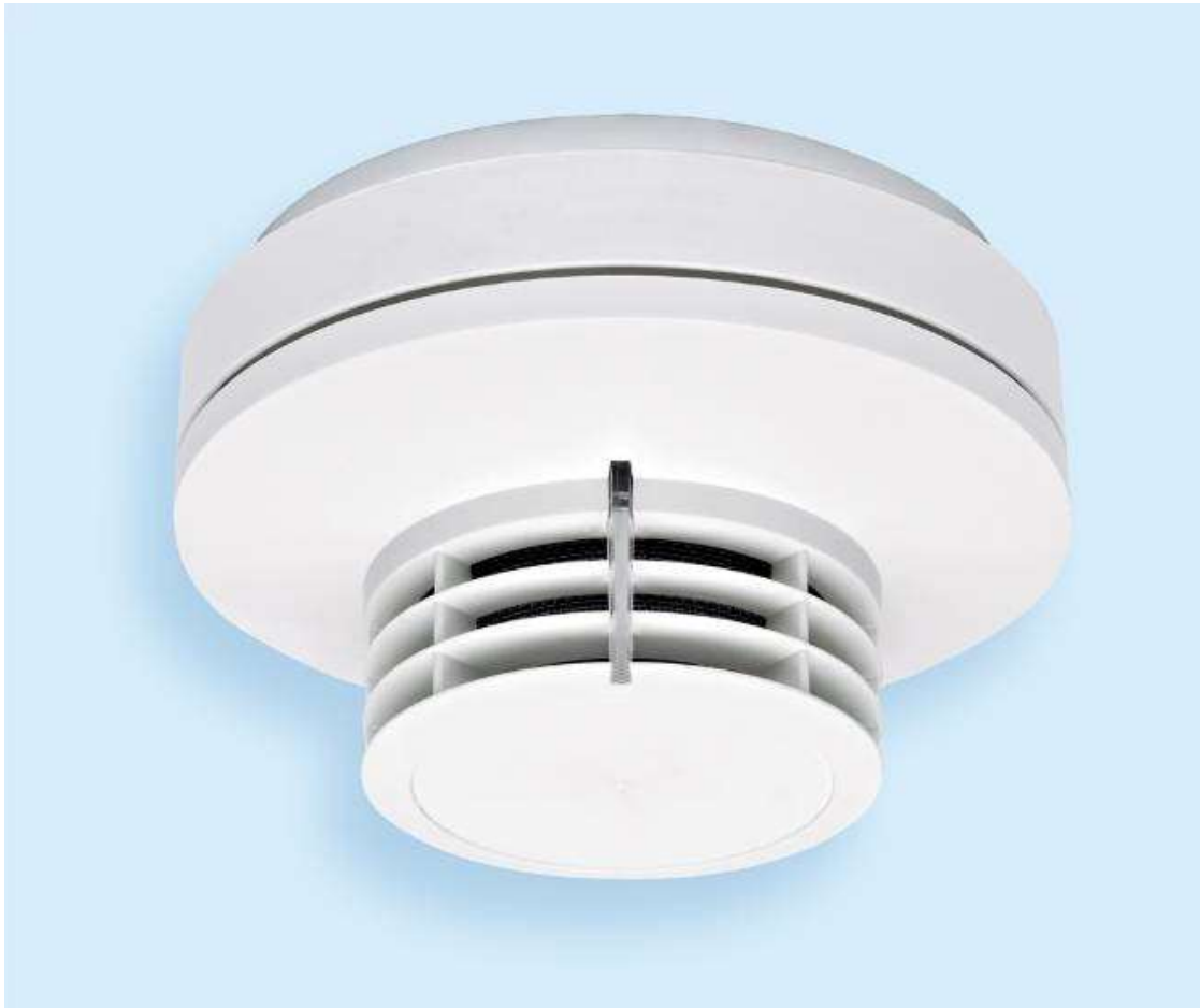
Kombinált füst- és hőérzékelő

A rendszer kialakítása során elvárás volt, hogy a rendszer hurokhiba esetén is működőképes maradjon . Ezt úgy sikerült elérni, hogy minden érzékelőbe és minden hurok modulba beépített zárlatszakaszolóval a hurok hiba esetén is teljesen működőképes marad. Az adatvezetékek a külső kezelőmezőig és a részközpontok közötti összeköttetések is kétszeresen vannak fektetve, hogy vezetékszakadások vagy hibák esetén a rendszer teljes működőképessége minden esetben biztosított legyen.