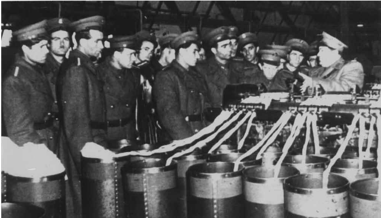
Tűzrendészeti ellenőrzési gyakorlat a szövőgyárban

A tanfolyamok hallgatói részére a tanulmányi, a szolgálati és a közösségi munka megszervezése volt az egyik legfontosabb feladat. A szabadidő hasznos eltöltését biztosította a könyvtár létrehozása, az énekkarok, a színjátszó- és a falujáró csoportok megalakítása. Egyre inkább javuló elhelyezési körülmények között történt a szakoktatás, a rendszeres egyéni tanulás, valamint a tanulókörökben folyó tevékenység.