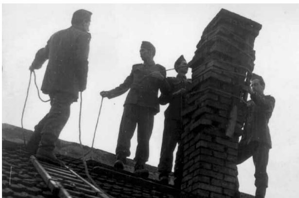
A tisztképzőszak hallgatói a taksonyi földrengés által okozott károk felszámolásában

volt tisztavató ünnepség. A kiképzési időtartam 8-tól 14 hónapig tartott. A tanulmányokat eredményesen befejezők létszáma összesen – a felsőfokú tűzoltó tanfolyamon végzettekkel együtt – 638 fő volt.