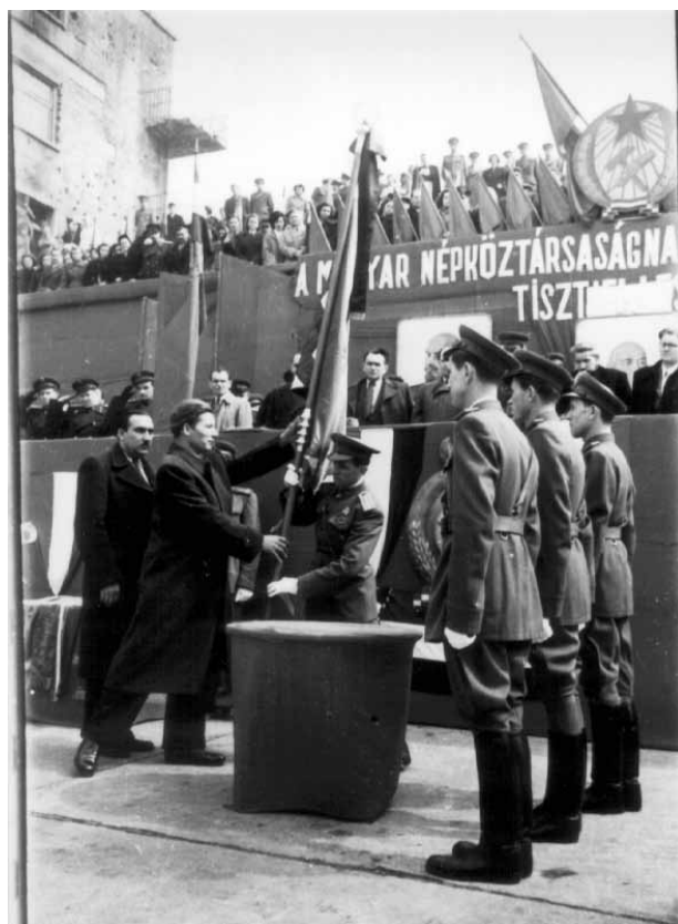
A csapatzászló átadásának-átvételének ünnepélyes mozzanata (1952)

Az iskolán a munka zavartalanságáért, a kellő tanulmányi színvonal biztosításáért, az előadók felkészültségéért az iskolaparancsnok és az iskolave-