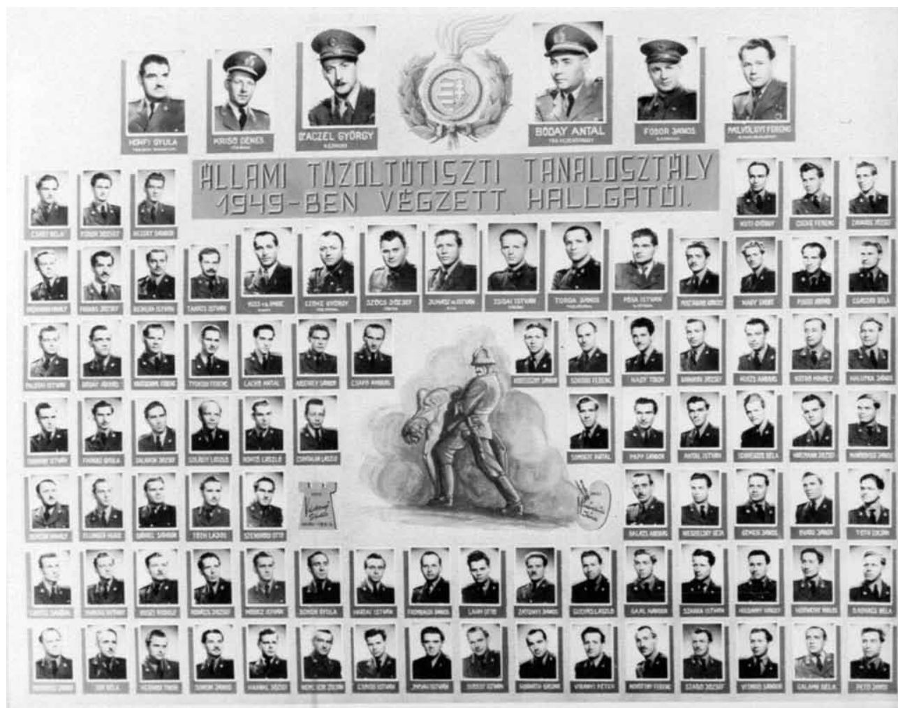
Az állami tiszti iskola tablója

Ha valaki visszalapoz az I. részhez, nagyfokú hasonlóságot talál az 1930-as évek tanfolyamszervezésére vonatkozó miniszteri szabályozások és a képzés újraindítását szolgáló – itt idézett – előírások között. A hasonlóság nem véletlen. A korábbi elvek