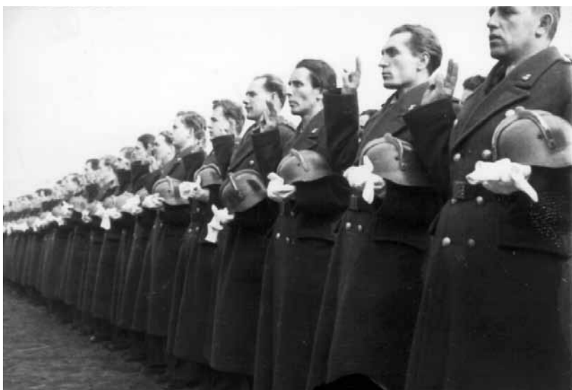
Az állami tűzoltótiszt-tanosztály végzett hallgatóinak eskütétele a zárőnnepségen (balra) Hallgatók az árvízi munkálatokban (jobbra)

Az iskola elnevezésében, szervezetében, oktató-nevelő tevékenységében többször történtek változtatások. Az iskola 1948-ig Felsőfokú Tűzoltótanfolyam, 1948-1951-ig Tűzoltótiszt-képző Tanosztály, 1951-től (1963-ig) „Petőfi” Tűzoltótiszt-képző Iskola elnevezéssel működött.