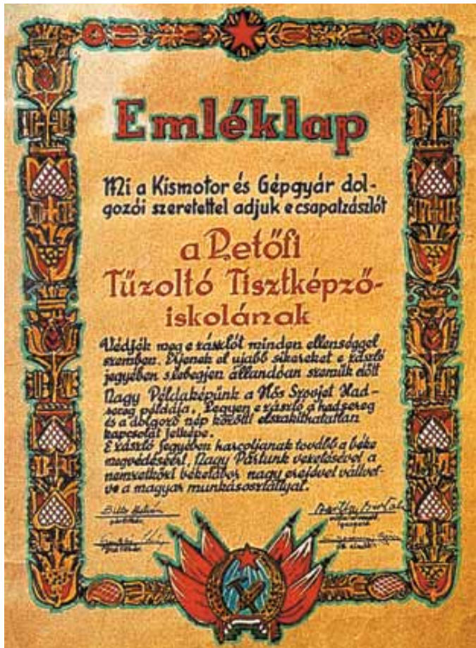
A csapatzászlót adományozó Kismotor és Gépgyár emléklapja